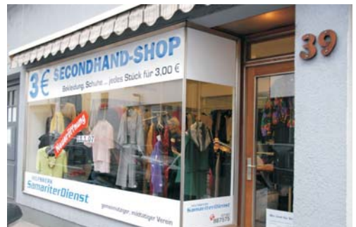
Gartenstrasse 39, Göppingen